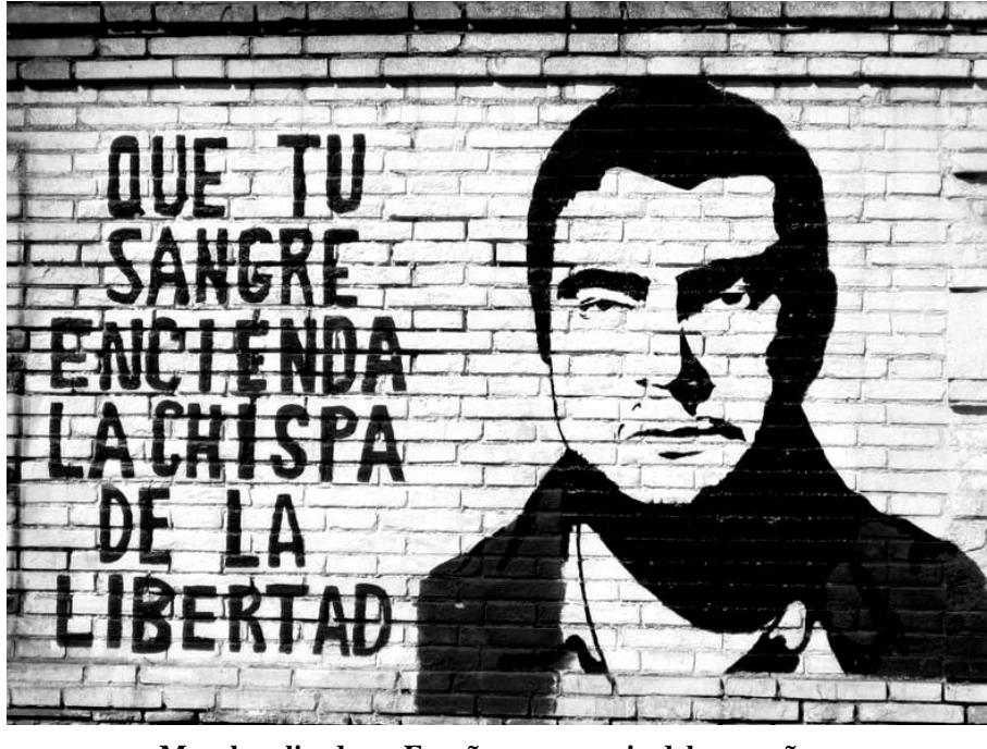
Mural realizado en España en memoria del compañero

activo en la lucha por la libertad de todos los presos, durante la transición de la dictadura franquista a la democracia., momento en que fueron anmistiad*s l*s pres*s politic*s, y l*s pres*s comunes emprendieron una lucha por su libertad, ya que consideraban que ell*s también eran pres*s de las condiciones políticas y económicas.