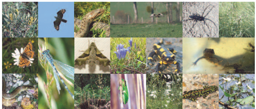
Piment royal, Bondrée apivore, Coronelle lisse, Busard Saint-Martin, grand Capricorne, Épilobe des marais, Damier de Succise, Agrion de Mercure, Sphinx de l'Épilobe, Gentiane pneumonanthe, Salamandre tachetée, Triton crêté, Couleuvre d'esculape, Osmonde royale, Rainette arboricole, Phalangère à feuilles planes, Triton marbré, Flûteau nageant.