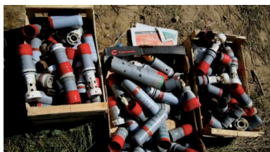
Caisses de grenades pour la plupart lacrymogènes, déversées après le 25 octobre devant la préfecture par les zadistes.

total, ont été utilisées dans la nuit du 25 octobre. Sur le terrain, on les ramassait encore à chaque pas une semaine après les faits.