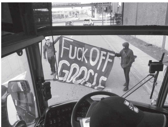
Oakland, 20 de diciembre de 2013