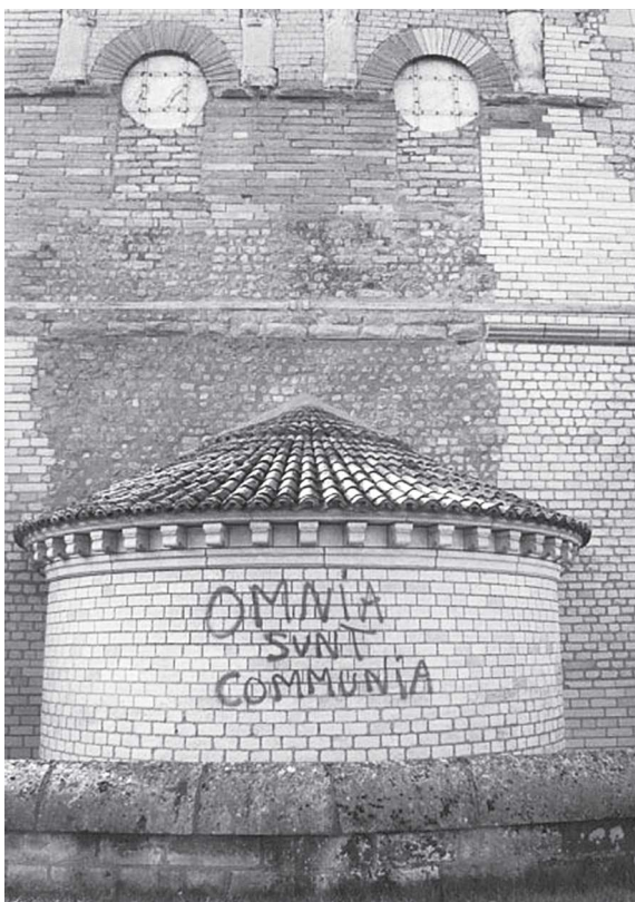
Poitiers, baptisterio Saint-Jean, 10 de octubre de 2009