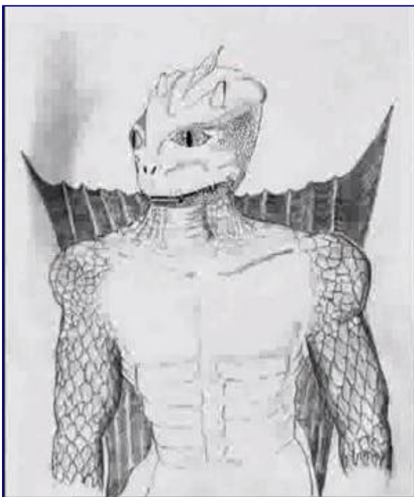
Roi Draco Blanc.