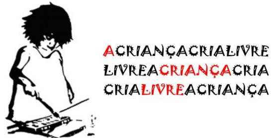
Figura 1 Imagem produzida pela cooperativa produzindo sem patrão.

Iniciamos esse tópico afirmando que temos muito que aprender com as crianças, infelizmente estamos amarradas com as cordas do adultocentrismo nos impedindo de observar, sentir, viver sua extraordinária forma de ser, ou seja, de construir conhecimento, cultura. Abrimos com essa introdução para descrever um diálogo que tivemos com uma criança (nove anos) nesse projeto, que revelou a expressão do seu desejo.