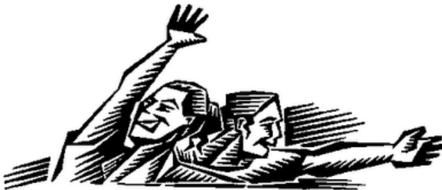
Abbildung: C. L. Harper, Rini Templeton