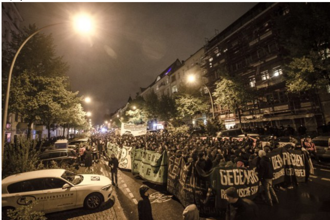
Image: May Day in Berlin this year, where side-banners are used in succession to defend against police flanking.

We need our own side-banners to help delineate and defend this bloc. Without side-banners, we have nothing to prevent police from easily cutting into the crowd to make targeted arrests. Side-banners also help to obscure police vision on who is doing what. They are a mobile barricade, and we need to start prioritizing their deployment.