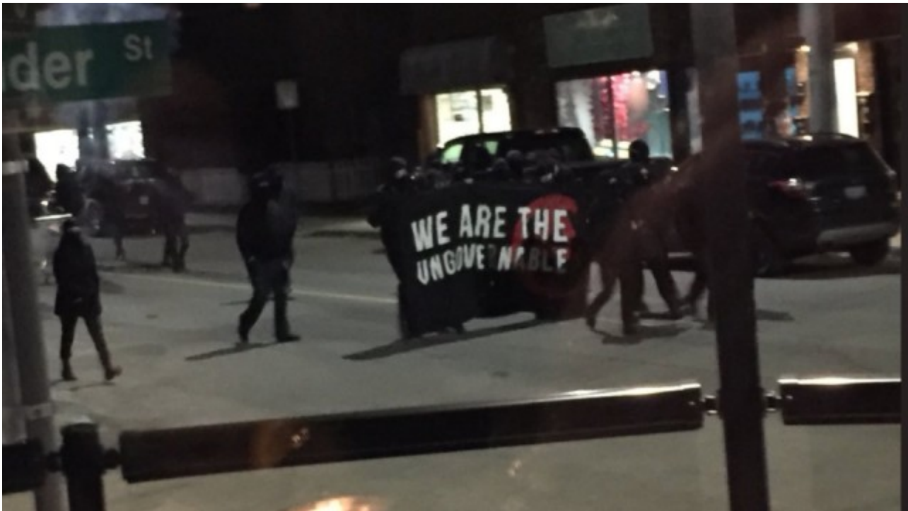
[Reformulé depuis divers articles de presse]