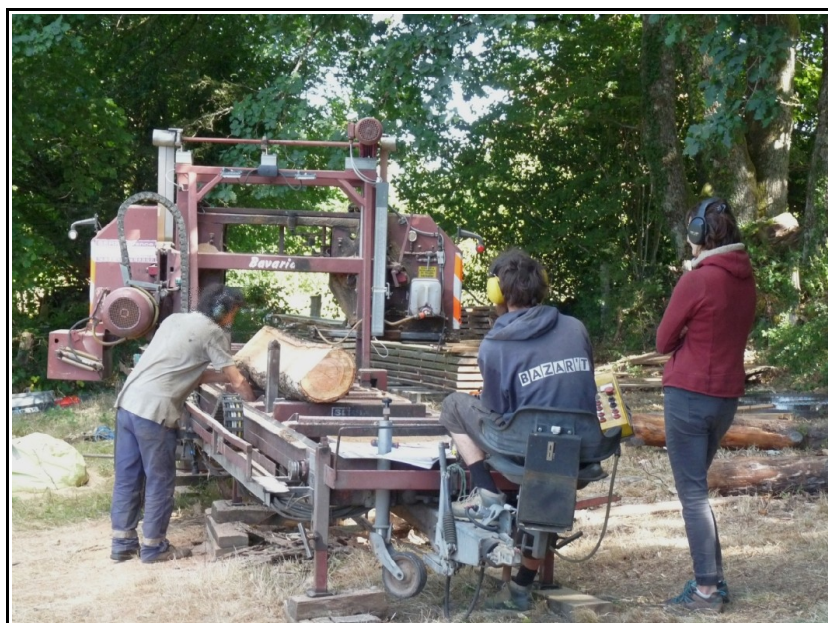
Prise en main des commandes

Nous étions accompagnés de l'ancien propriétaire de la scie, qui nous a transmis une partie de son savoir-faire.