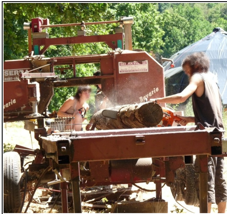
Débiter du bois...

Puis, en gagnant en confiance petit à petit, nous avons poursuivi seuls en débitant des planches, des plateaux et des chevrons dans des grumes de différentes essences : frêne, chêne, châtaignier, douglas.