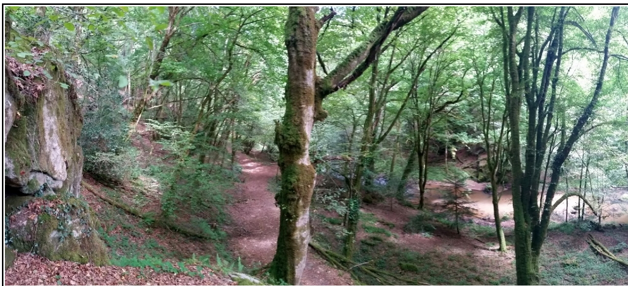
Dans les gorges du Doustre, été 2020

Ce massif d'un seul tenant, d'une grande valeur écologique et patrimoniale, est situé dans les gorges du Doustre. Il est constitué en majorité de feuillus, et contient des plantations éparses de sapin blanc et de Douglas. L'association projette d'y mener des inventaires forestiers, des suivis de la faune et de la flore, ainsi que des petits chantiers forestiers et des formations de sylviculture douce.