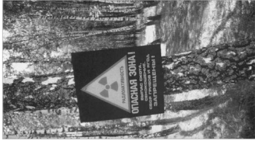
Лес в зоне Чернобыльской катастрофы

Анти-технология – это не идеология, которая указывает другим, как жить, она также не предназначена для того, чтобы смоделировать идеальный мир. Ее главной целью является остановить технологическую систему и заставить ее сделать шаг назад.